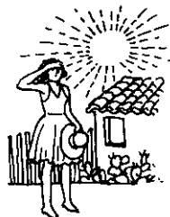
It is hot outside - חם בחוץ

*The words with an asterisk have suffixes attached to them in the weather forecast chart shown above. These indicate basic grammar rules that are very easy to learn. On the next page I'll show you the suffixes along with the words so you can see how they are used: