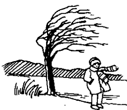
It is cold outside - קר בחוץ